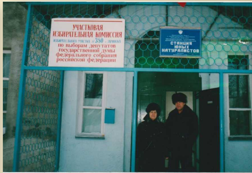
Ф. 1. 617. Выборы депутатов Государственной Думы Федерального Собрания Российской Федерации четвертого созыва 7 декабря 2003 года.

Голосование граждан на избирательном участке № 379. 2003 год