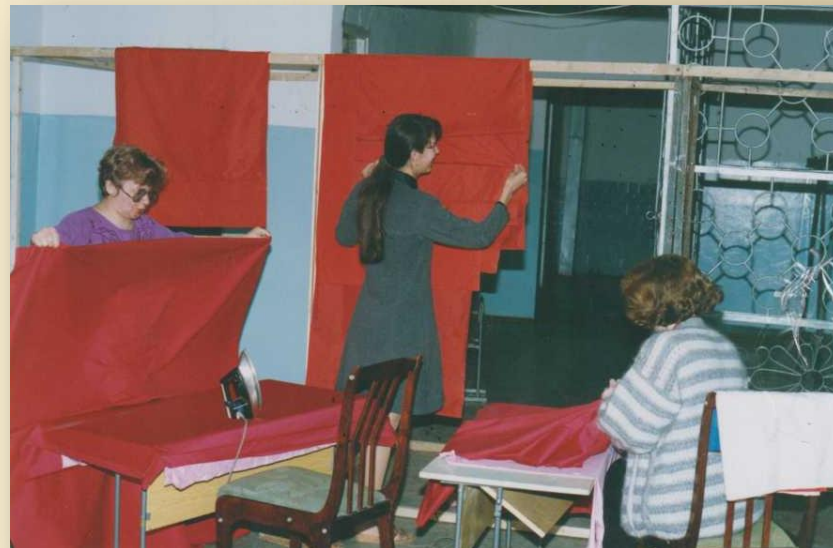
Ф. 1. 438. Оформление кабин для голосования по выборам Президента РФ на избирательном участке № 337. 15 июня 1996 года