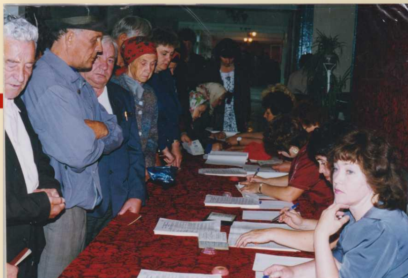
Ф. 1. 423. Голосование на избирательном участке № 334 во время выборов Президента РФ. 16 июня 1996 года