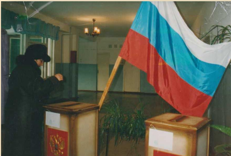
Ф. 1. 614. Выборы депутатов Государственной Думы Федерального Собрания Российской Федерации четвертого созыва 7 декабря 2003 года.

Голосование граждан на избирательном участке № 379. 2003 год